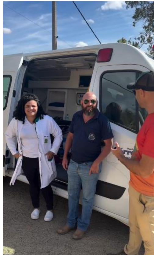
Apoio da Polícia Militar e da estrutura de saúde da prefeitura (ambulância e enfermeiros)