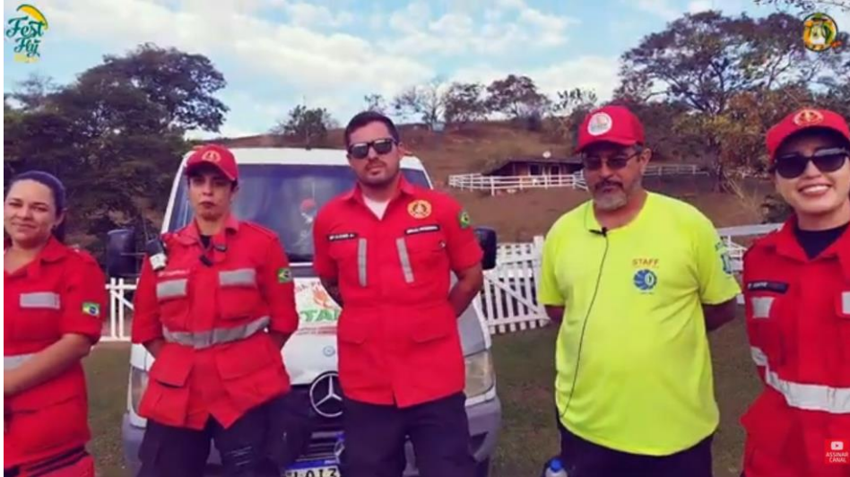
Brigadistas e ambulância

Além disso, na cidade de Cambuí/MG, que fica a 5 km (10 minutos) de Córrego do Bom Jesus, possui estrutura hospitalar pública e SAMU.