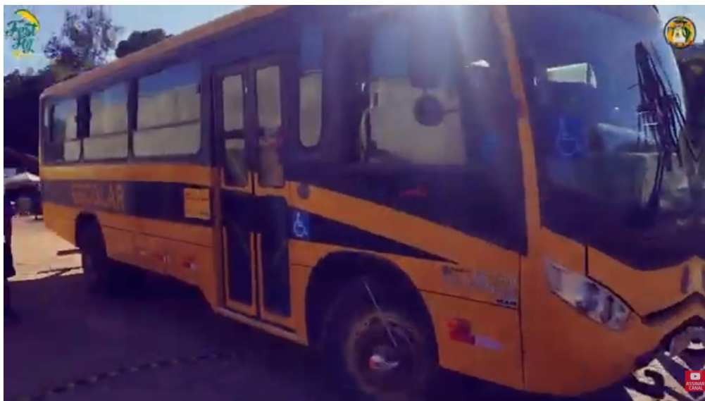
Ônibus usado para resgate

Os veículos a serem utilizados para levar os pilotos até a rampa e também para o resgate serão fornecidos pela prefeitura, conforme edições anteriores e conta com a frota municipal de transporte rural (ônibus e vans adaptadas para o transporte de crianças da zona rural às escolas). A logística será coordenada por membros da comissão de organização, em contato com os pilotos.